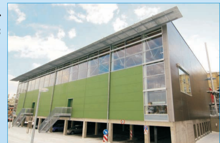
2.000 Schüler profitieren von der neugebauten Dreifachturnhalle.

Freilich bleibt noch viel zu tun. Nur eine starke CSU bringt Hof weiter voran. Geben Sie uns am 2. März mit Ihrer Stimme den Auftrag.