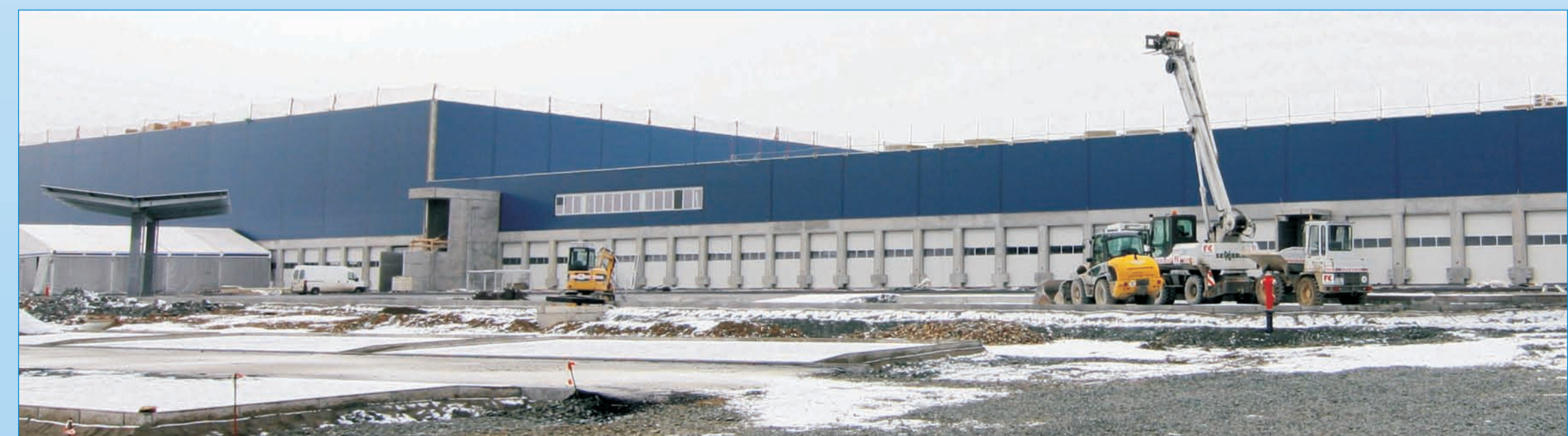
Beispiel für erfolgreiche Strukturpolitik und gelungene Wirtschaftsförderung: Die Firma Dachser baut für 30 Millionen Euro in Hof.