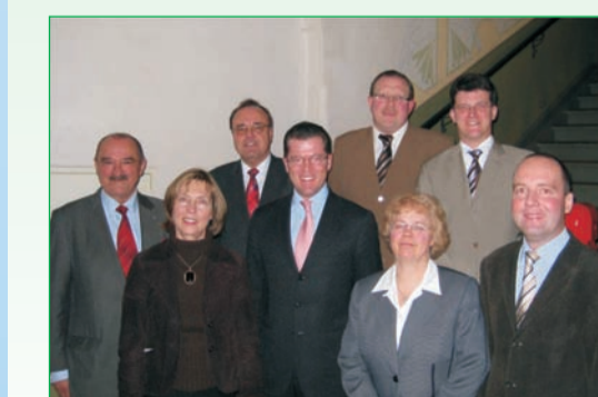
Der neue CSU-Bezirksvorsitzende Dr. Karl-Theodor von Guttenberg spricht bei einer Wahlkampfveranstaltung am 30.01.2008 im Haus Theresienstein. Das Bild zeigt ihn im Kreis des CSU-Fraktionsvorstandes.

DESHALB: EINE STARKE CSU IM HOFER STADTRAT!